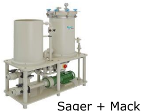
Sager + Mack